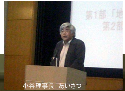
小谷理事長 あいさつ